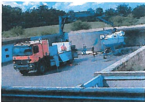
Sejlbåd, der strandede syd for Nr. Vorupør mandag den 18. juli 2005 – besætning var to tyske lystsejlere