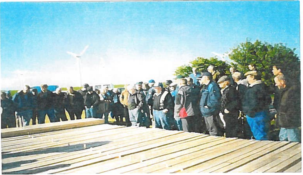
På det øverste billede ses tømmeret, da det var i gang med at blive solgt. Mange var mødt op for at se på tømmeret, og nogle var så heldige at få købt noget af det, som det ses på det nederste billede, hvor en lastbil er ved at blive læsset.